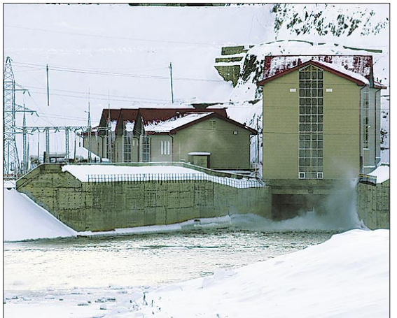
Окончание на 2-й стр.

Оборудование станции уникальное, высочайшая степень автоматизации. Кстати, поэтому ГЭС может работать как при максимальных притоках воды, так и при минимальных. Компьютер выбирает оптимальные режимы работы не только для генераторов, но и для гидротурбин, и автоматически регулирует их. На всех других станциях России регулирование работы турбин производится с помощью механических регуляторов, а значит, в большей мере эффективность их работы зависит от субъективных факторов, от опыта работников. Благодаря автоматической системе управления агрегаты Юмагузинской ГЭС имеют наивысший КПД. Значит, выше эффективность и ниже себестоимость энергии.