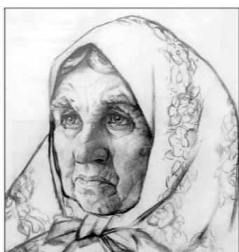
Портрет матери (уголь, бумага, 1974 г.).