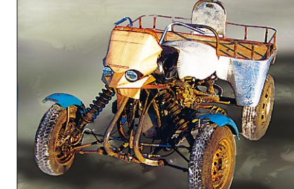
динением, которое тоже заинтересовало разработку из Мелеузовского района. Ведь если установить на «Акаваз» двигатель УМПО, квадрицикл автоматически становится внутрибашкирской продукцией.

Большие надежды конструктор из поселка Нугуш связывает с Уфимским моторостроительным производственным объе-