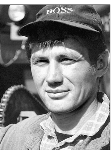
Беседу вел Анатолий АЛЬШИЦ.

И все же многое уже сделано. Земли бывшего совхоза начинают получать минеральные удобрения.