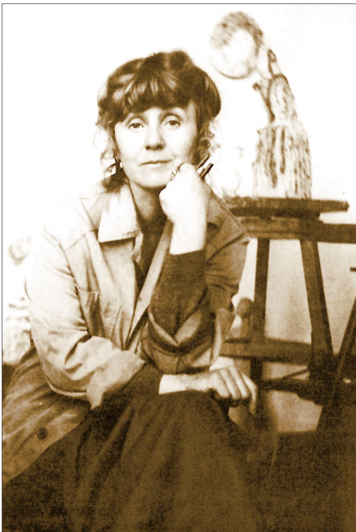
У скульптора в Уфе есть бронзовый ребенок.