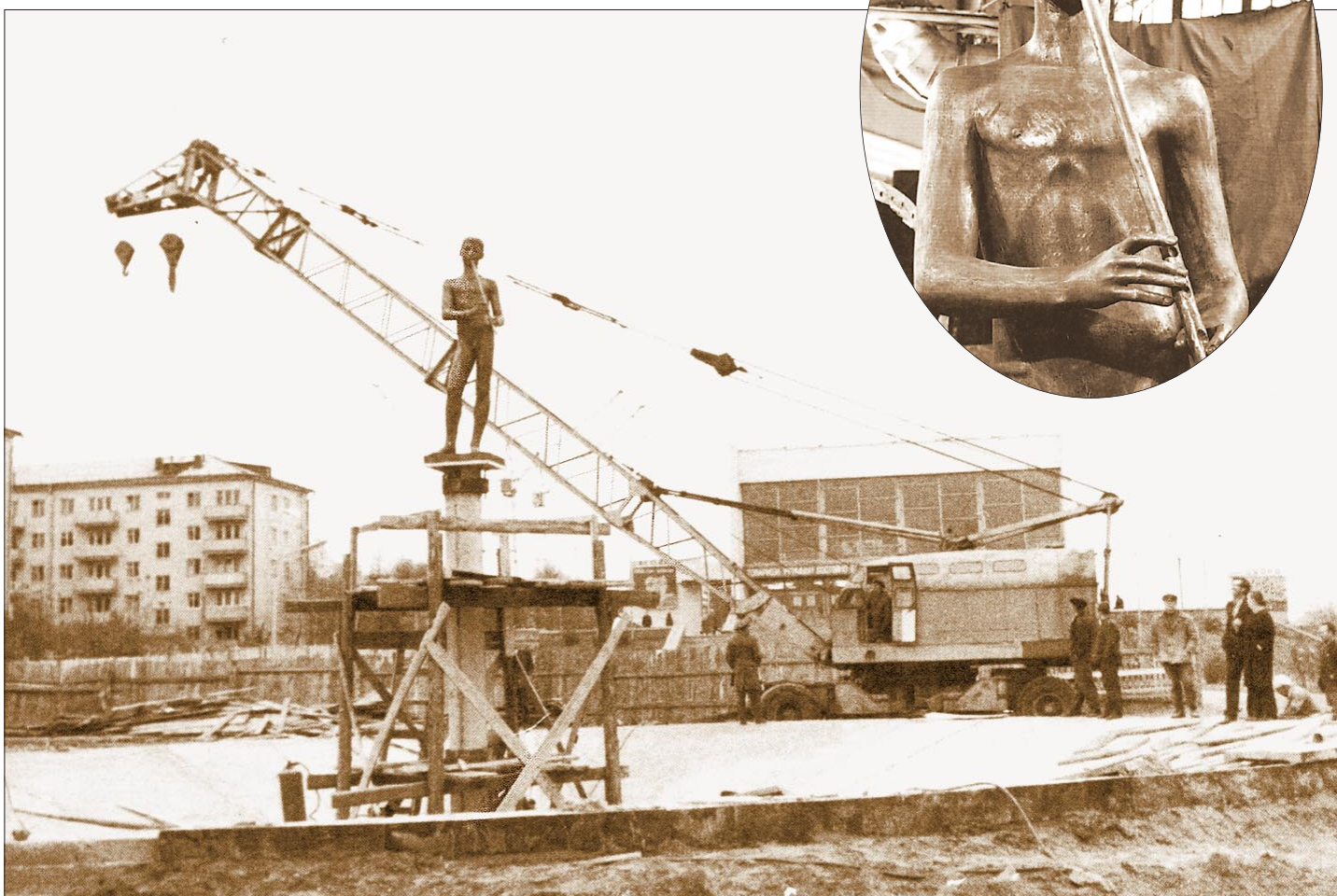
Мальчик остался нагим благодаря грекам.

— Насчет трусиков... Понимаю, что это была шутка. Ну, а если серьезно, зимой хорошо бы скульптуры закрывать. Обычно в Петербурге их «укрывают» досками, вроде как они в домике. «Мальчик» на колонне зимой