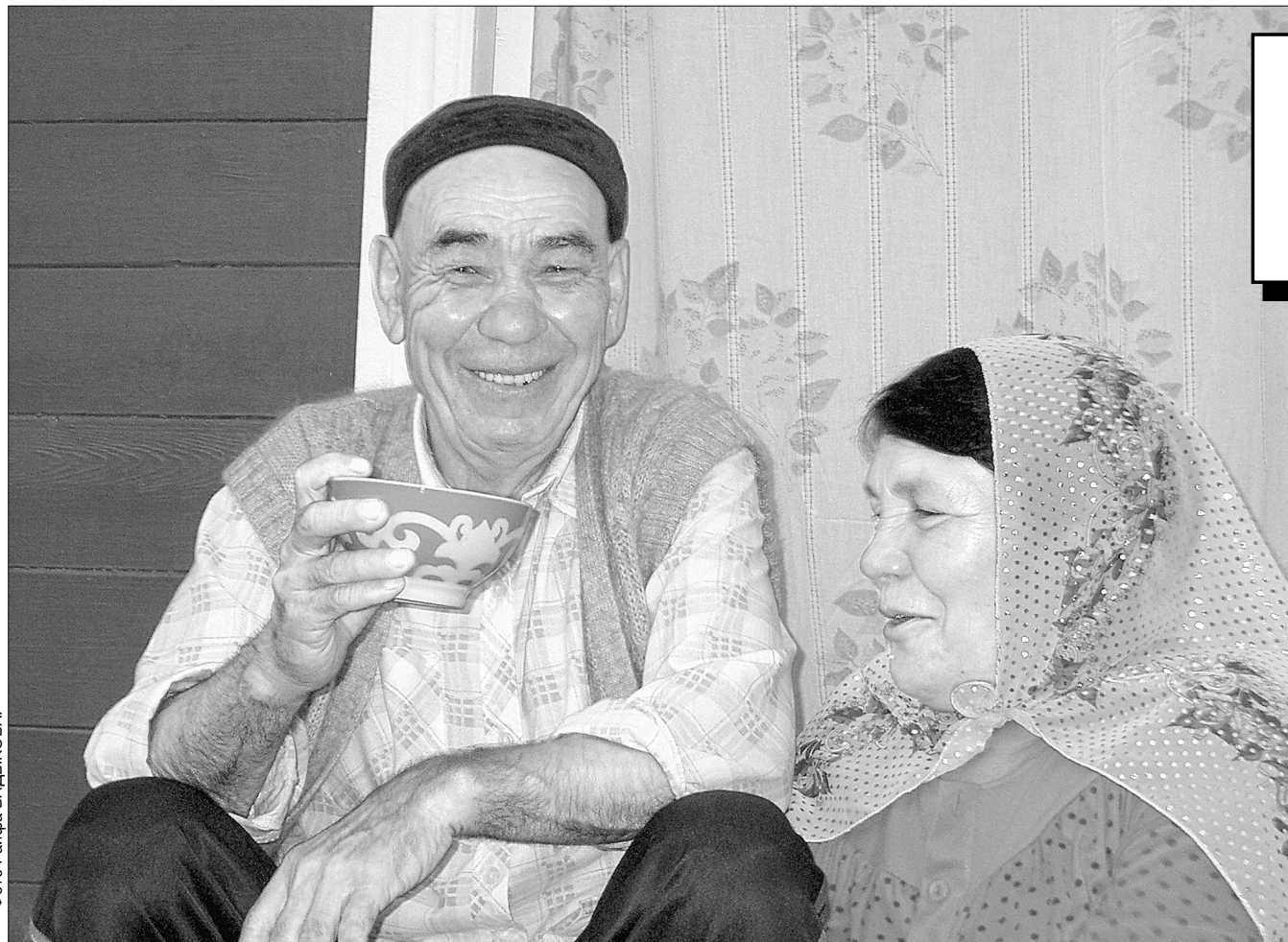
Жизнь хороша, когда пьешь чай не спеша.