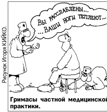
Грибсы частной медицинской практики.

Ответственные за выпуск: С. ГАБРИЕЛОВ, П. ТРЯСКИН.