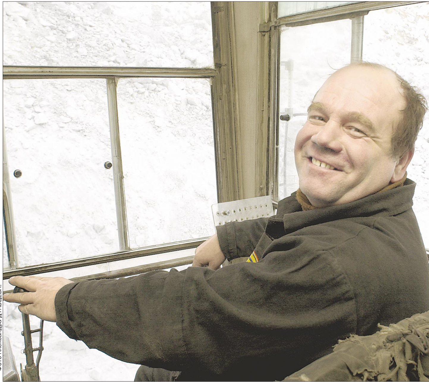
Идет погрузка известняка.

Кстати, строительство новой фабрики в карьере планировалось и даже начиналось около четверти века тому назад, но так и не завершилось. Теперь то, что сделано, безнадежно устарело. Фабрика будет строиться по новому проекту. Который осуществится наверняка и в короткий срок. Как того и требует новое время.