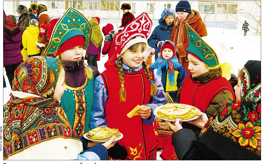
С пылу-жару на морозе хороши блины!