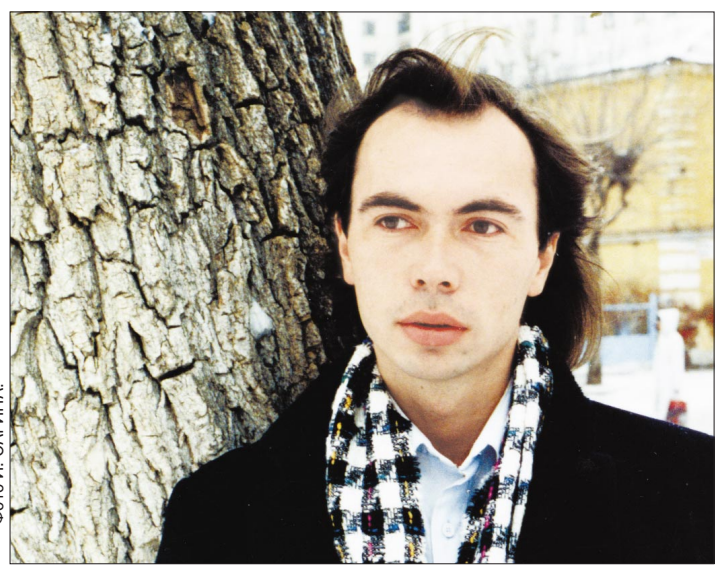
Чувство гармонии музыкант получил на генном уровне.

Даже пчеловодство может оказаться ключом в познании тайны творчества