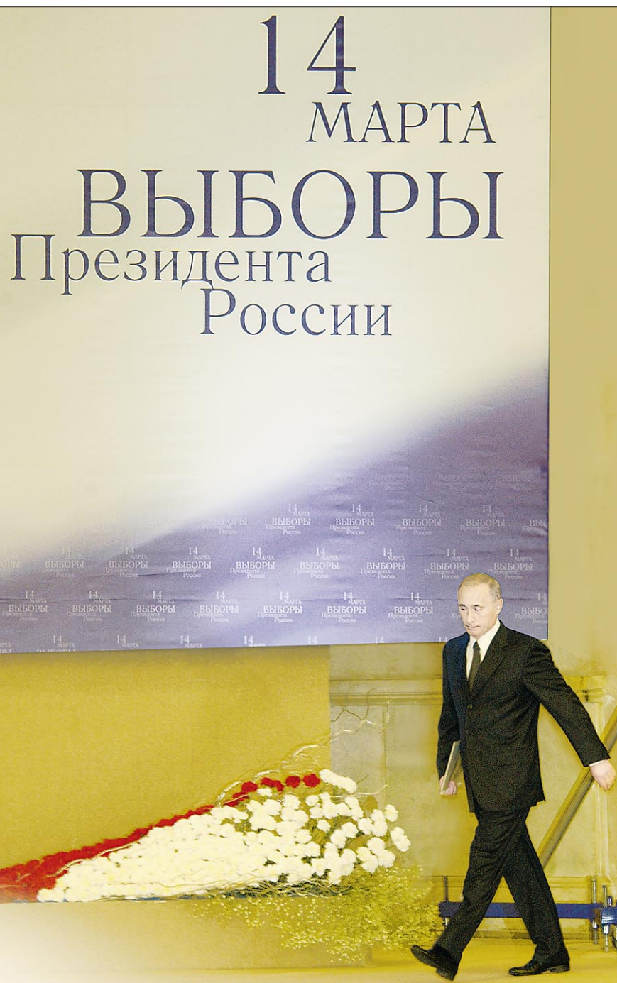
У Президента поступь уверенная. Обрести ее должна и Россия.

На встрече доверенные лица не боялись задавать острые вопросы. Мне кажется, это тоже примета времени — вре-