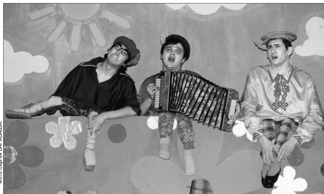
Сцена из спектакля «Приключения трюх».