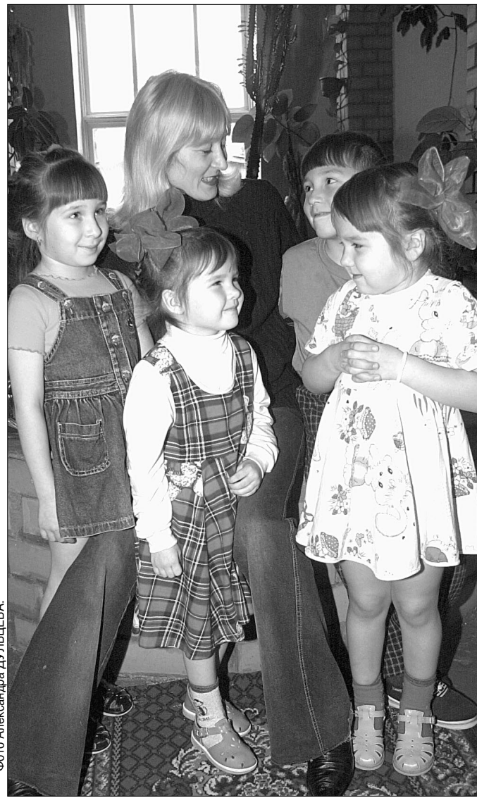
Дети в саду — счастье в нем.

Прошмыгнувшая юркая ящерица ребятишек не напугала, а, наоборот, вызвала у них радостные возгласы, поскольку они сами нашли ее летом в лесу и принесли в детский сад. Хвостатый озорник заднее обхождение так понравилось, что убежать обратно она не спешила. За окном холодный пейзаж, а в зимнем саду, где фотокор решил сделать снимок на память, тепло и уютно: в горшках произрастают различные экзотические растения, о чем-то своем твердят полугаи в ярком оперении, резвятся в аквариуме забавные мехокозябрыне сомики.