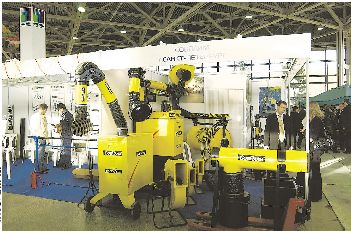
Одна из экспозиций выставки.

На выставке представлены наиболее эффективные технологии передачи и производства