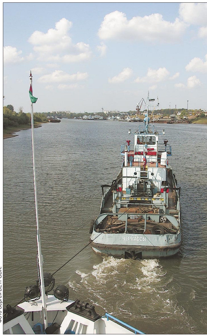
Теплоход идет к зимней стоянке в сопровождении буксира.

Двигаться по этому рукаву самостоятельно пассажирскому