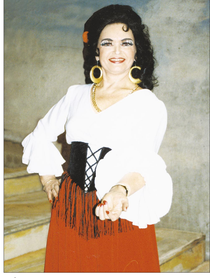
Любовь — законов всех она сильней!

Следующий этап пройдет 31 января и 1 февраля в Шадринске, а заключительный — 6 и 7 марта в Стерлитамаке. Елена ВТТЕВА. «Башинформ».