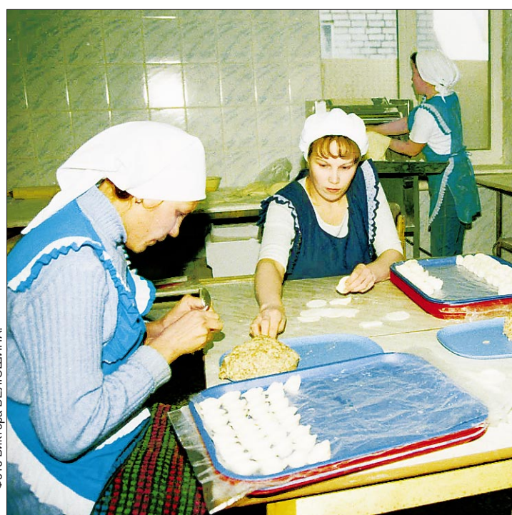
Работа спорится в руках чудиновских девчат.