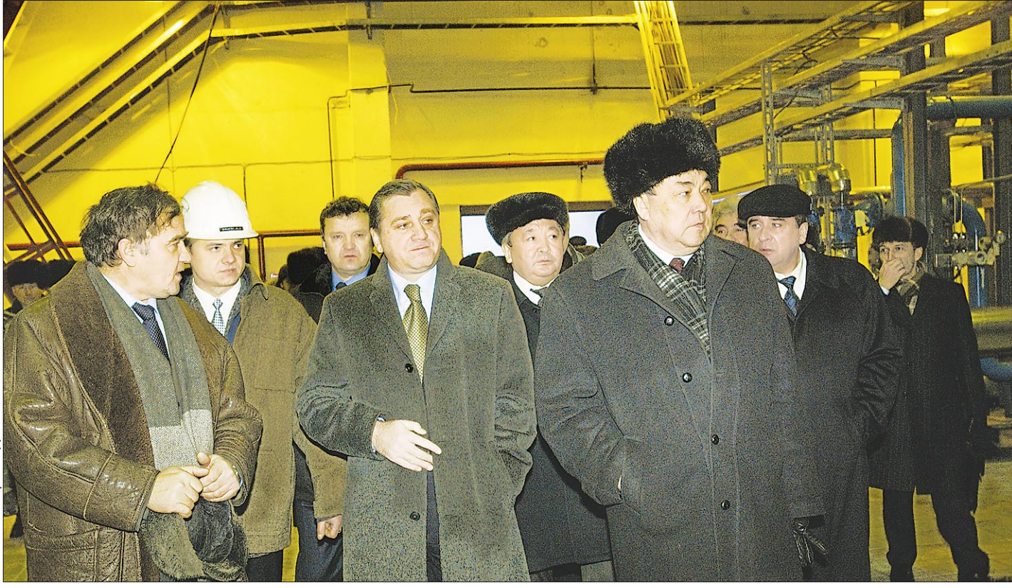
В одном из цехов пускового комплекса ОАО «Полиэф».